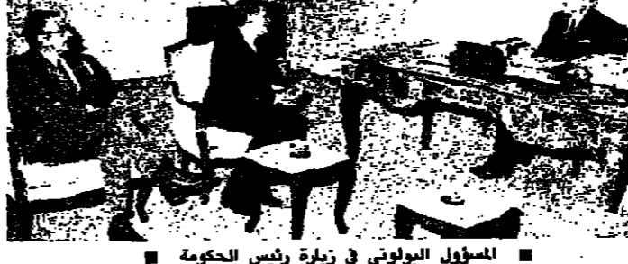
المسؤول البولوني في زيارة رئيس الحكومة

وتحدث سايابا فقال: ان بؤس الازمة الاقتصادية زرعته من بدء الاجتياح الاسرائيلي وبعد ستة من تلك بدأت تظهر. فلم يتم التصدي لها قبل تشرير الاول من العام ١٩٨٤. في الوقت الذي قد فيه المصارف الكبرى كل احتياجه تم بدأت الحكومة في التفكير بالاسروكيات كآواتة في آخر السنة ١٩٨٣ بمليارين ٦٠٠٠ مليون ليرة. وكان له «ههما ارتفاع سعر الدولار يسبق التمسك بشروطه لاقتحامهم من مريح».